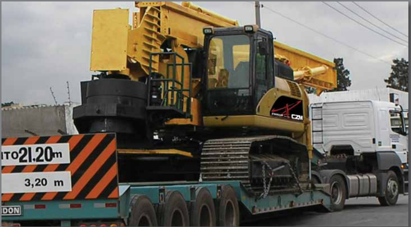
Posição de transporte - Transport position