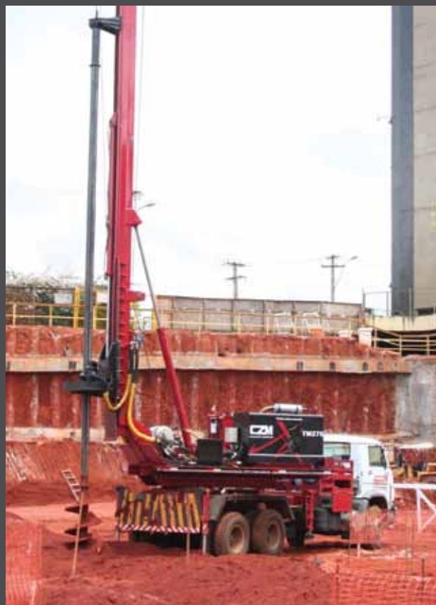
Montada sobre caminhão - Truck mounted

A CZM fabrica uma linha completa de perfuratrizes hidráulicas sobre esteiras e caminhões para fundações como: estaca raiz, hélice contínua, trado mecânico, estacas escavadas e bate estaca hidráulico. Para mais informações consulte: www.czm.com.br