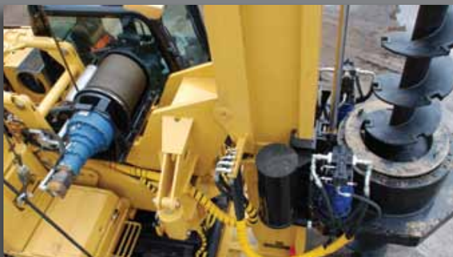
Vista superior - Upper view