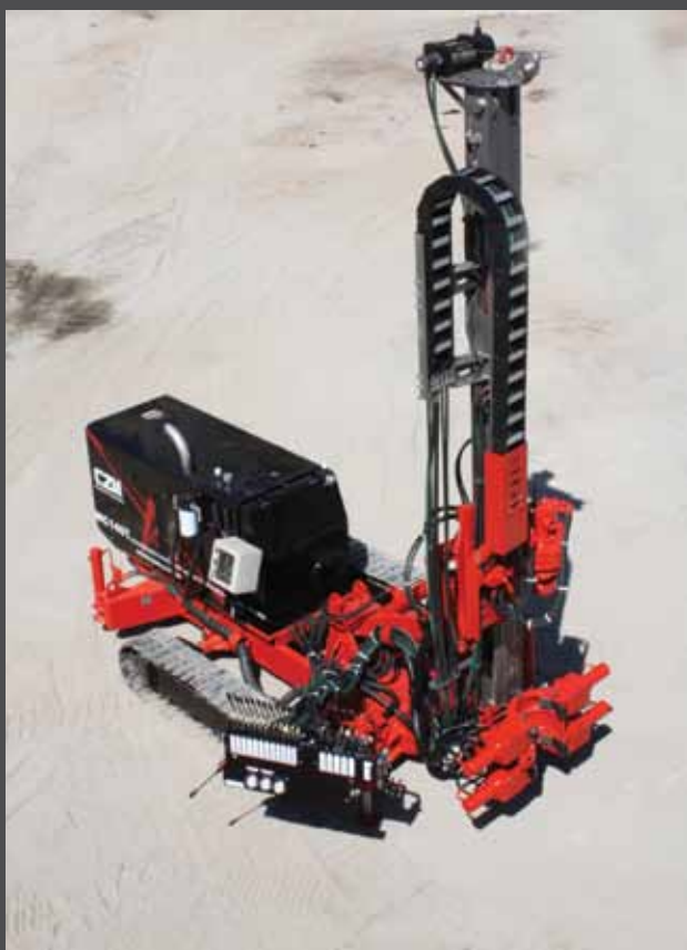
Mini esteiras - Mini crawlers

Especificações estão sujeitas a mudanças sem notificação prévia. Specifications are subject to changes without pre notice.