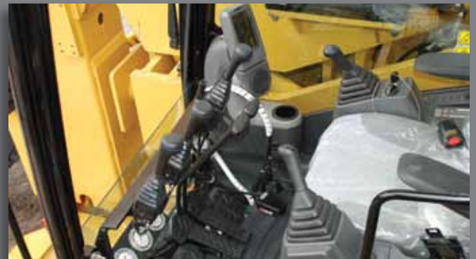
Painel de comandos - Control panel