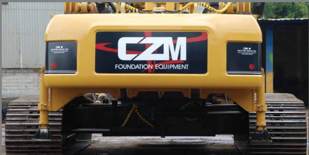
Esteiras estendidas - Extended crawlers